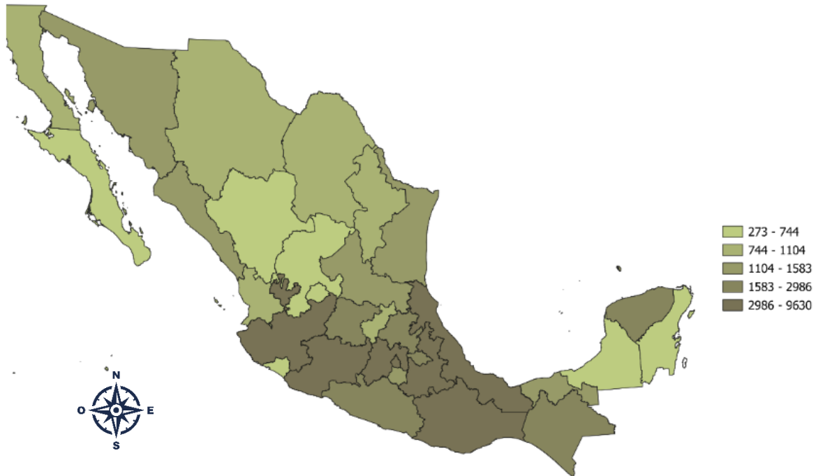
Figura 3 Concentración de panaderías por estado con 0 a 10 personas empleadas

Nota. Elaboración propia con datos de INEGI. Directorio Estadístico Nacional de Unidades Económicas (DENUE, 2024).