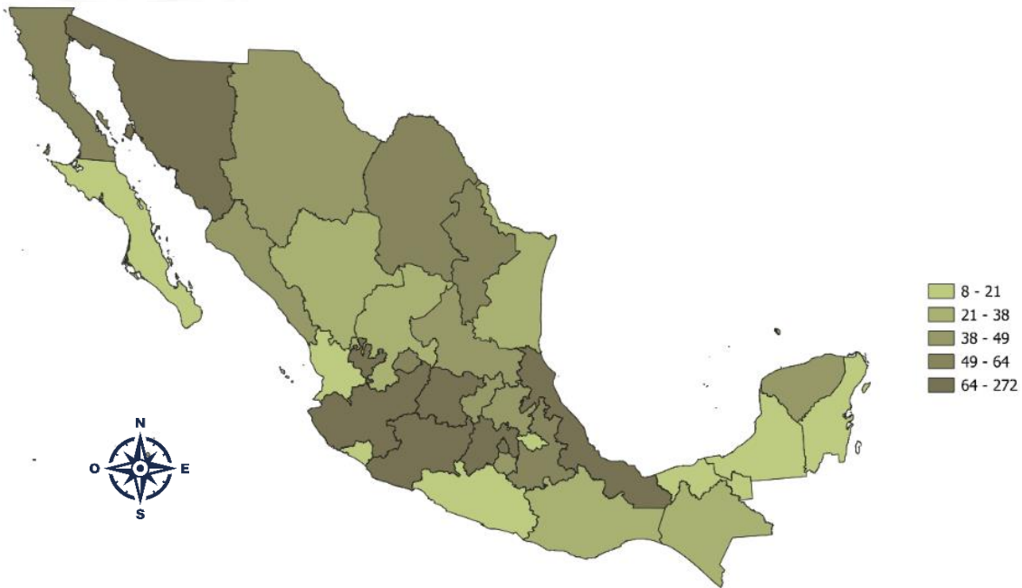
Figura 4 Concentración de panaderías por estado con 11 a 50 personas empleadas

Nota. Elaboración propia con datos de INEGI. Directorio Estadístico Nacional de Unidades Económicas (DENUE, 2024).