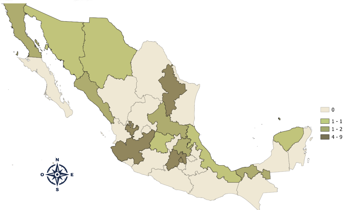
Figura 6 Concentración de panaderías por estado con 251 y más personas empleadas

Nota. Elaboración propia con datos de INEGI. Directorio Estadístico Nacional de Unidades Económicas (DENUE, 2024).