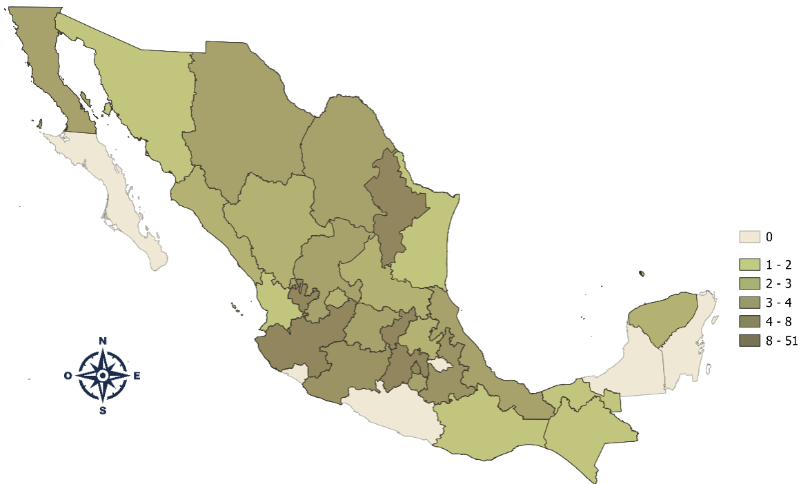
Figura 5 Concentración de panaderías por estado con 51 a 250 personas

Nota. Elaboración propia con datos de INEGI. Directorio Estadístico Nacional de Unidades Económicas (DENUE, 2024).